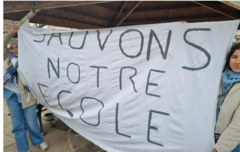
Enseignants et parents d'élèves de l'école élémentaire Paul-Émile Victor se sont mobilisés en début d'année pour dire non à la fermeture d'une classe.

« Nous sommes en désaccord avec l'Inspection académique qui a prononcé sa fermeture », souligne Patrick Odiard (Les Écologistes), l'adjoint à l'Éducation, au moment où le conseil devait délibérer sur l'attribu-